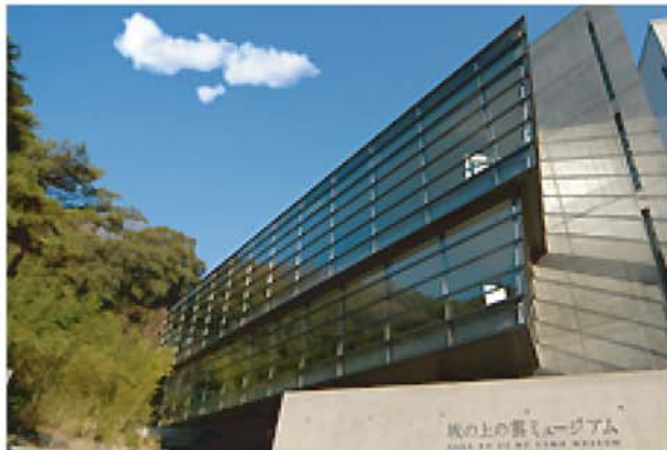
外観(安藤忠雄氏設計)