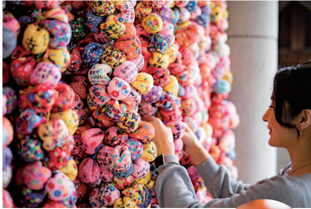
4 #엔만지 절 연애 성취의 파워 스포트로 여성들에게 큰 인기