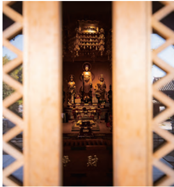
6 #호곤지 절