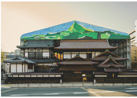
3 #도고 온천 본관 현재는 동쪽 입구에서 입관 후 입욕 가능