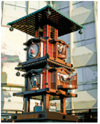
#붓짱 카라쿠리 시계탑

해질녘의 온천 거리는 많은 여행자들이 활기칩니다. 새로운 온천이 계속해서 흘러나오는 족욕탕(무료)에 발을 담그거나 인형이 춤추는 카라쿠리 시계도 관람이 가능합니다. (오전8시~오후10시 사이에 한 시간 마다. 토·일요일, 휴일, 성수기는 30분마다)