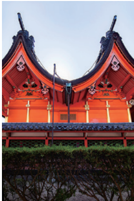
7 #이사니와진자 신사