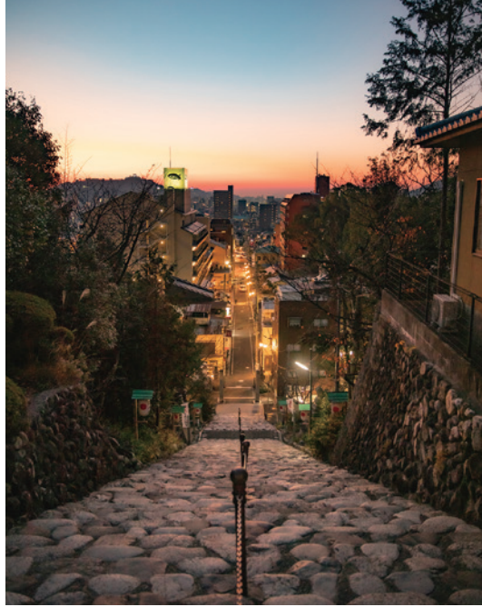
7 #이사니와진자 신사 오길 잘했다고 생각이 드는 조망!