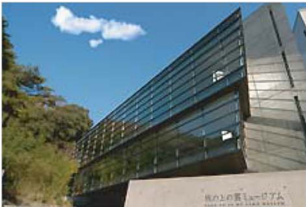
외관 (안도 타다오씨 설계)