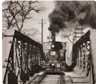
大约在昭和28年横渡横河原线石手川铁桥的“公子哥列车”