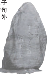
正冈子规句碑 (JR松山车站前)