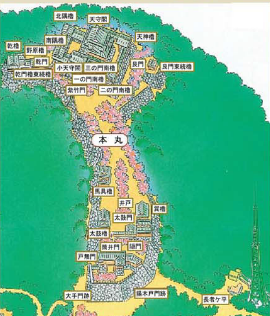
山頂の「長者ヶ平」で降りたら天守閣まで徒歩10分です。