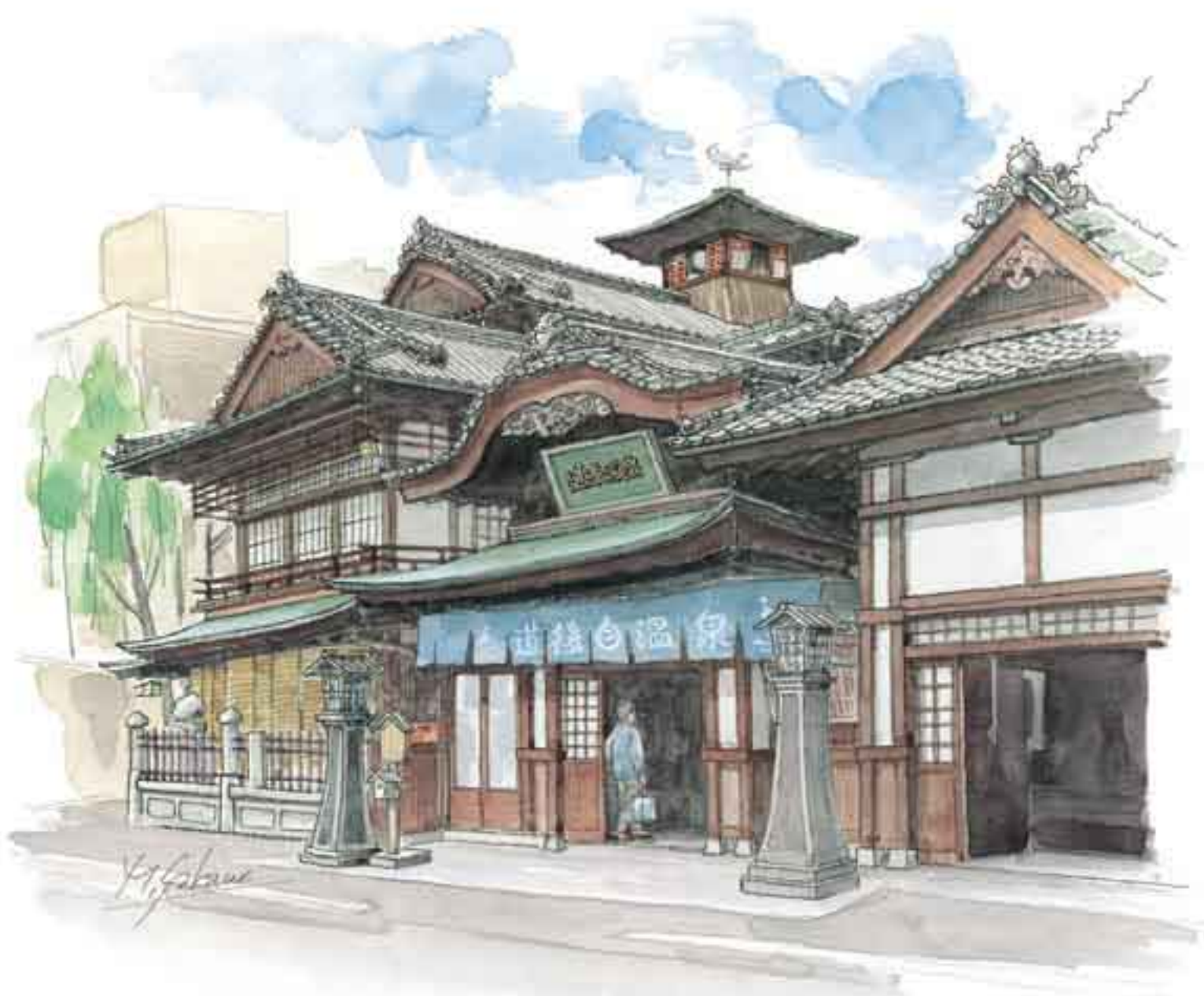
道後温泉本館／松山市