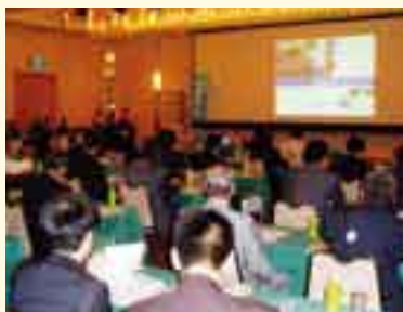
松山市観光説明会の様子

また、「第34回松山の物産と観光展」の前日31日(火)の松山市観光説明会においては、中京地区のエージェント・観光関係団体を招聘し、松山の観光情報を提供するなど、観光客及びコンベンション誘致に努め多大な成果を挙げる事ができました。