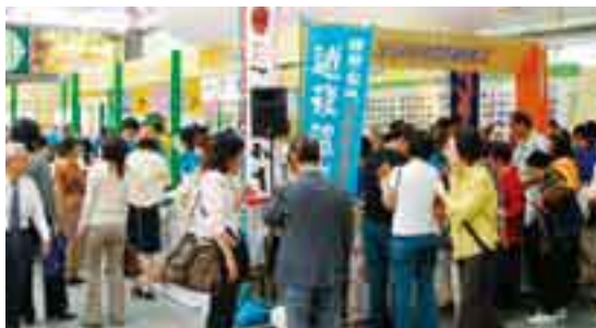
物産と観光展の様子

観光案内コーナーでは、松山マドンナ大使による案内や観光資料の配布・観光ビデオの上映など、松山の