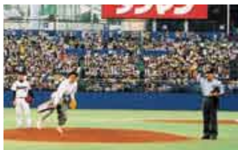
松山市長始球式の様子