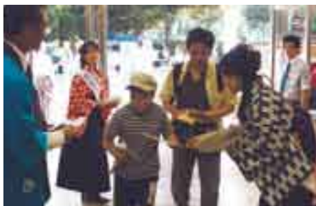
マドンナ大使による記念品配布の様子

試合開始前には、古田敦也選手2,000本安打達成の映像に合わせて松山市をPR。両軍の選手代表にマドンナ大使が花束を贈呈、松山市長(ヤクルトスワローズ松山協力会会長 中村時広氏)(財)松山観光コンベンシヨ