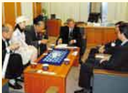
(財)名古屋観光コンベンションビューロー表敬訪問

観光宣伝を行うとともに、観光情報を提供し、松山城・道後温泉をはじめ、主要観光地のポスターを掲示し、いっしょに湯と城と文学のまち松山のPRに努めました。しかしながら、開催中に、一日中、雨が降るなど悪天候に見舞われたため、前回の売上を上回ることができませんでした。