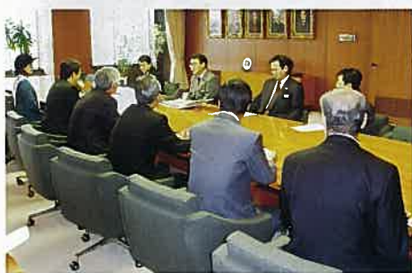
札幌市表敬訪問の様子