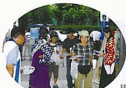
記念品配布の様子

試合途中の3回裏終了後、松山城、道後温泉、坊っちゃん列車を紹介した映像と合わせて松山市をPR。5回裏終了後には、ラッキープレゼントの当選者発表を行い、抽選で松山・道後温泉旅行(2泊3日)をペア組、松山城と道後温泉の図書カード及び道後温泉の大判バスタオルを10名様にプレゼントしました。