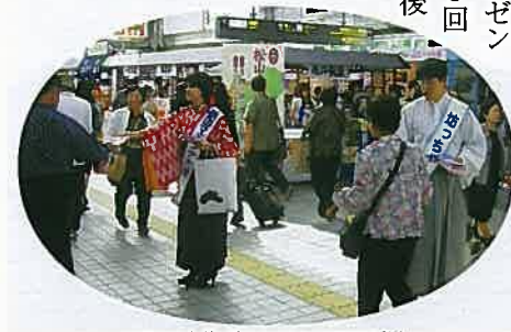
マドンナ大使・坊っちゃんによるPR活動