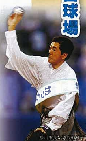
松山市長始球式の様子

「松山DAY in 神宮球場」観光キャンペーンは平成18年7月14日(金)に、東京ヤクルトスワローズのホームグラウンドである神宮球場でプロ野球東京ヤクルトV.S巨人戦において実施しました。7月14日現在、東京ヤクルトは3位で優勝争いを演じており、大勢の東京ヤクルトファンが応援に来ていました。その一方で巨人は連敗の続く試合が多く5位と低迷していたこともあり、巨人ファンの来場者が少なく、当日は2万332人の来場者でした。