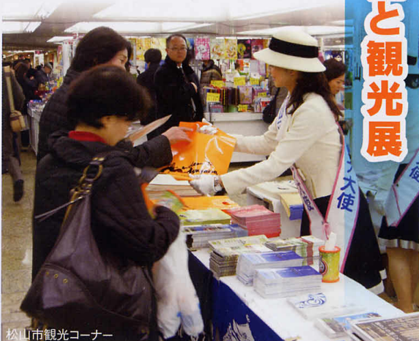
松山市観光コーナー

ネル展」を開催しました。その他、ことは文化の面から松山市を紹介したパネル展も同時開催し、松山の人情・文化・味を首都圏の方々に広く紹介することができ、多大の成果を挙げることができました。