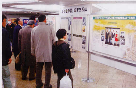
NHK スペシャルドラマ「坂の上の雲」パネル展