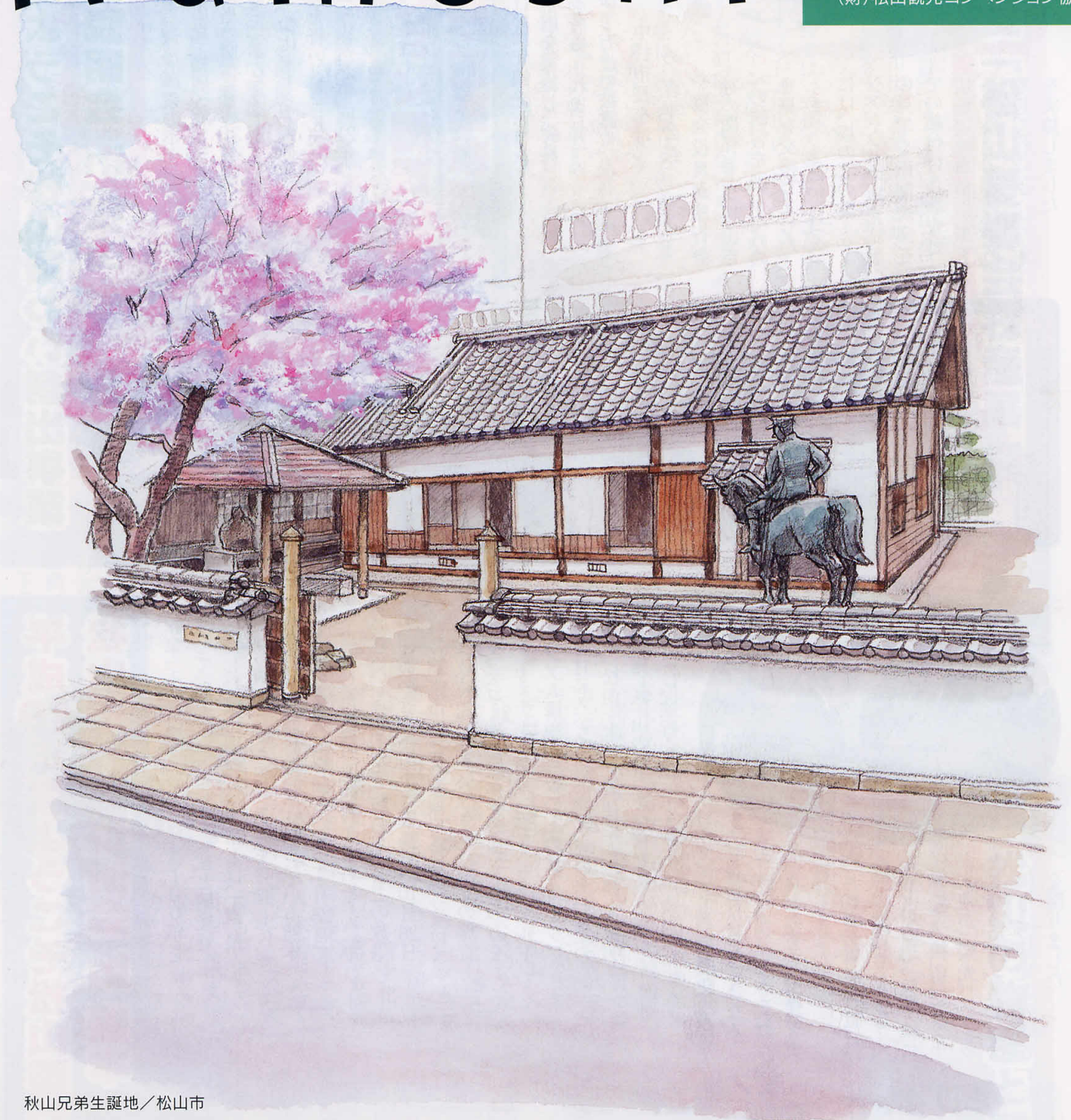
秋山兄弟生誕地／松山市