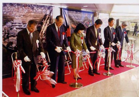
開展式(テープカット)

観光部門としては、2009年(平成21年)放映予定のNHKスペシャルドラマ「坂の上の雲」を紹介した、パネル展や平成19年4月28日にオープンした「坂の上の雲ミュージアム」のパネル展をはじめ、「四国八十八ヶ所霊場パ