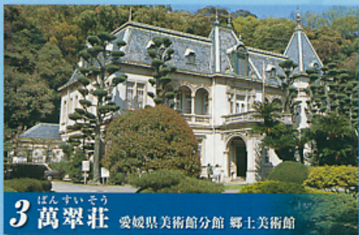
3 ばんすいそう 万翠荘 愛媛県美術館分館 郷土美術館

江戸時代に藩校明教館があった場所で、明治時代には勝山学校・松山中学校として近代教育の拠点となった。少年時代の正岡子規や秋山真之がここで学び、明治28(1895)年には後の文豪・夏目漱石が松山中学校に英語教師として赴任した。現在は、漱石が松山を去る際に詠んだ句とともに記念碑が建てられている。(明教館は現在、松山東高等学校に移築・復元されている)