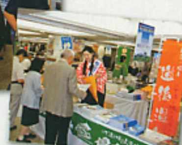
■松山市観光コーナー