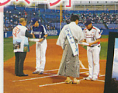
■両球団選手へ記念品贈呈

観光キャンペーンでは、特に本年11月29日(日)から放映開始のスペシャルドラマ「坂の上の雲」の告知や「まつやま農林水産物ブランド」の紹介等を行い、「坂の上の雲」のまち松山を大勢の首都圏の方々に十分にPRすることができました。