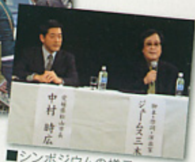
■シンポジウムの様子