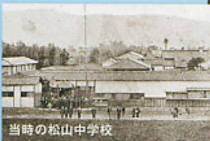
当時の松山中学校