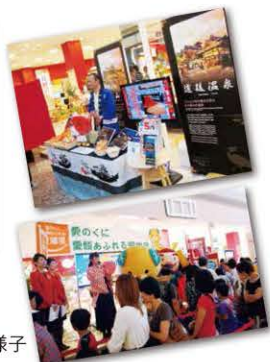
■イベント会場の様子