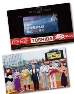
■セレモニーの様子