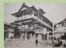
明治時代の道後温泉本館

美しくレトロなたたずまいの道後温泉本館は、明治27年(1894年)に当時の日本における和と洋の技を結集させて建てられた近代和風建築です。120年の歴史の中で、正岡子規や夏目漱石などをはじめ多くの文人・偉人らが道後温泉に通いました。平成6年(1994年)には国の重要文化財にも指定されています。