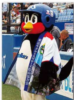
■松山PRハッピー姿の「つば九郎」

観光キャンペーンでは、オーロラビジョンの映像を通して、来年、道後温泉本館改築120年を迎える道後温泉を中心に、四国・松山の訴求を行い、また、東京ヤクルトスワローズの協力を得て、公式マスコット「つば九郎」が「松山PRハッピー」を球場内で着用するなど、大勢の首都圏の方々に松山をPRすることができました。