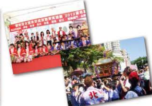
■観光PRブースの様子(昨年10月) ■子供神輿パレードの様子(昨年10月)