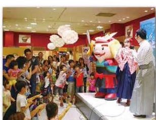
■野球拳大会の様子

一日平均5万人が訪れるショッピングモールにおいて、イベント会場だけでなく、館内にある86ヶ所の大型液晶モニターやインターネット(USTREAM)上で、イベントの様子が配信されるなど、イベントと連動した効果的なPRを実施することができました。