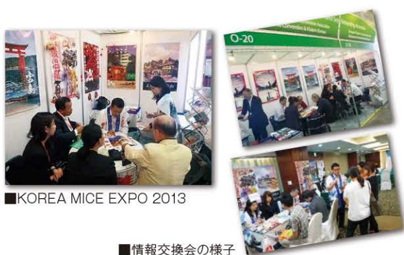
■KOREA MICE EXPO 2013

また、6月28日にはソウルのコリアホテルで、韓国旅行会社関係者等31名を対象とする、観光情報説明会並びに交流会を実施しました。会場内では各コンベンション団体がブースを設け、情報提供を行うとともに、抽選会等も実施することで、終始活発な意見交換及び交流を行いました。