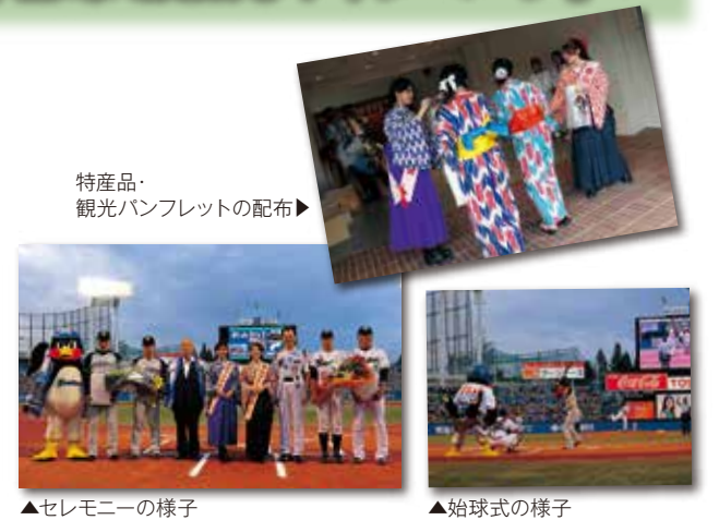
特産品・観光パンフレットの配布

今年度は松山城・道後温泉のほか、正岡子規・夏目漱石生誕150年のPRを中心に、のぼり・ポスターの掲出やカラービジョンでのPR映像を放映するとともに、来場者先着1,000名に特産品や観光パンフレットを配布し、首都圏の方々に四国・松山をアピールしました。