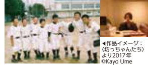
梅佳代「坊っちゃんたち」 道後商店街にて