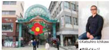
大巻伸嗣「作品名未定」 道後商店街正面入口にて