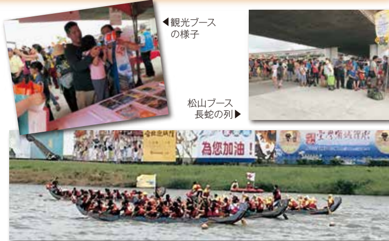
▲ドラゴンボートレースの様子

当初予定していた広域地図を的にしたピストルダーツゲームは、初日、2日目とも悪天候のため、急ぎょジャンケン大会に変更。最終日ようやくピストルダーツゲームを実施しました。3日間とも、お客様が途切れることなく長蛇の列で賑わい、来場者の方には、より一層「松山」の地名を印象づけることができました。