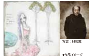
宇野亜喜良「恋愛辞典」 オールドイングランド道後山の手ホテルにて