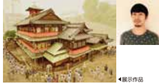
浅田政志 「鷺の恩返し 第八章 その式・朝六時、本日も湯が湧き人集う」 道後観光案内所壁面に