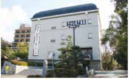
松山市立子規記念博物館 正岡子規を中心に、夏目漱石や松山市が生んだ文人たちの業績を集大成した、およそ6万点の実物資料や書籍を所蔵している博物館です。