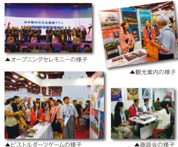
▲オープニングセレモニーの様子

松山ブースでは、台湾でのイベントで大人気となっている「ピストルダーツゲーム」を実施(中国・四国地方の観光地図をデザインした的を設置し、松山市に命中した方に、ノベルティを配布)することでブースへの集客を図るとともに愛媛・松山をより一層印象付けながら、道後温泉・松山城・しまなみ海道をはじめとした愛媛県内の魅力をパンフレットや観光DVD映像で紹介しました。また、イベント初日には商談会にも参加し、台湾の航空会社・旅行会社の担当者に愛媛県松山市への送客について協力依頼するなど有意義な意見交換ができました。なお、イベント開催中に会場を訪れた方は4日間で延べ256,673人を数え、非常に大きな宣伝効果が得られました。