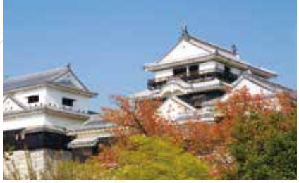
松山城 松山市の中心部、勝山山頂の松山城は、1602年から加藤嘉明が四半世紀かけて築いた、姫路城・和歌山城と並ぶ連立式天守をもつ平山城です。