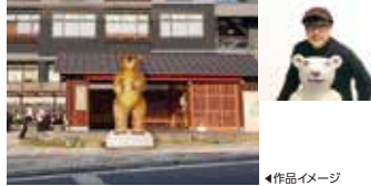
三沢厚彦 「Animal 2017-01-B2(クマ)」 振鷲亭前にて