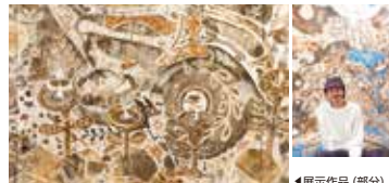
浅井裕介「豊かさ」／「土の星の人」 椿の湯1階ロビーにて