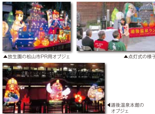
▲放生園の松山市PR用オブジェ

また、7月14日～8月14日の間、松山市主催の松山城本丸広場等をイルミネーションで彩った「光のおもてなし in 松山城」のイベントにも、松山城などのランタンオブジェを出展し、多くの方々にご鑑賞いただきました。