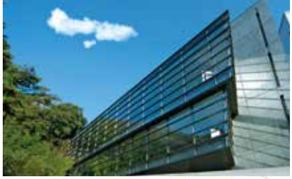
坂の上の雲ミュージアム 松山城南麓に位置し、周囲の環境と調和した『坂の上の雲』のまちづくりの中核施設。小説の魅力などを伝えるさまざまな展示をしています。