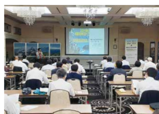
講演会の会場の様子

オンサイトでのエリアシンポジウムは「withコロナafterコロナのMICEのカタチ」と題し、当協会の支援やコンベンション開催で活用できるSDGsの取り組みなどについて講演するとともに、ミニ展示会も開設。地元企業7社がコロナ対策に関する取り組みや商材についてPRする事で、参加者が最新の機器や情報に触れる機会を創出しました。