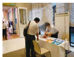
ミニ展示会で商談をする来場者