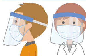
フェイスシールド